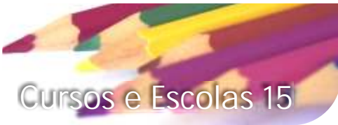
Cursos e Escolas 15